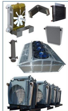
HEAT EXCHANGERS & COOLING SYSTEMS